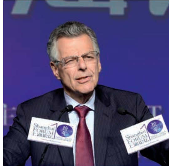
Myron S. Scholes